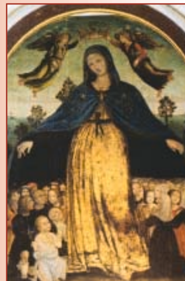
Pieve Caina, parrocchiale di Santa Maria Assunta. Michelangelo di Maestro Matteo, "Madonna della Misericordia", tempera su tavola, 1528.

This itinerary was launched in Marsciano on December 8, 2002 with a guided visit and a final concert of sacred music.