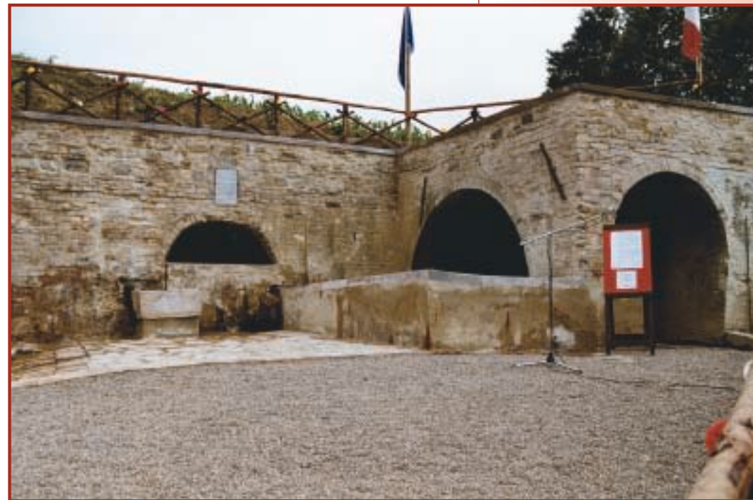
Fonte di San Costanzo

Di poco più innanzi rispetto alla chiesa, sempre lungo la strada che sale verso il borgo, un'indicazione cattura la nostra attenzione; essa ci indica la Fonte di San Costanzo , l'antica fonte che, situata lungo la via che unisce direttamente Castello delle Forme a Sant'Enea e costruita nel 1296 per volontà dei magistrati perugini, si può ammirare anche di notte dopo il restauro di recente avvenuto che ne ha rispolverato l'antico splendore. Nella centralissima Piazza Vittorio Emanuele, dove