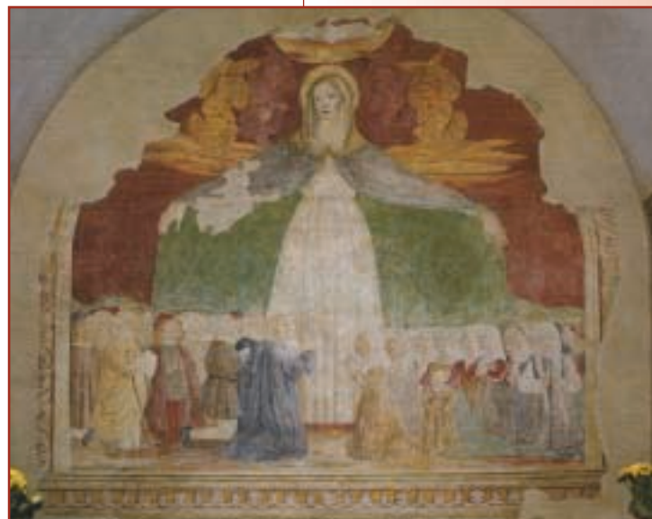
Marsciano, chiesa della Madonna di Tripoli. Ignoto, "Madonna della Misericordia", affresco.

Nel terreno attorno furono fatte trincee ma senza risultato; al-