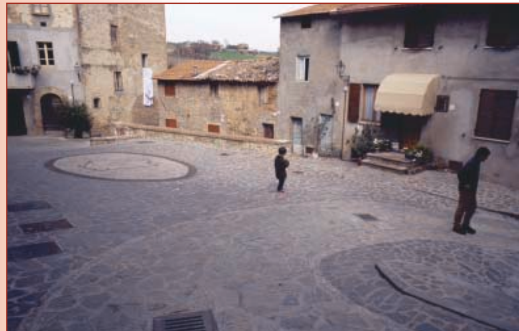
Borgo Medievale di Papiano, piazza Simone da Papiano

discovering its old magnificence. In the central Vittorio Emanuele square, we can admire Palazzo Boncambi a noble building of the XVIII century characterized by a stone arch, and the Bell Tower , a symbol of our rural centres.