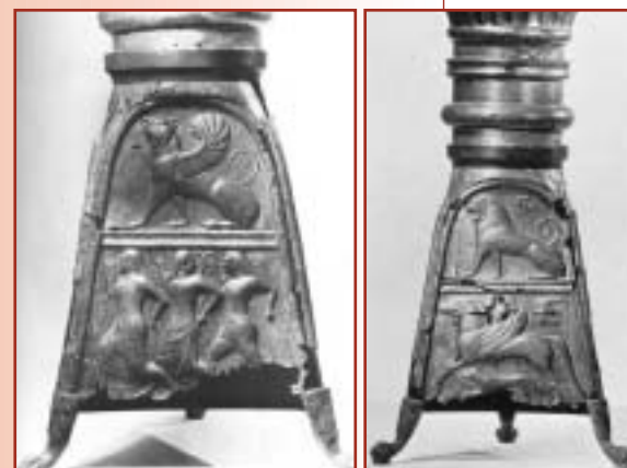
Antikensammlungen di Monaco di Baviera, Tripodi "Loeb" di San Valentino, seconda metà VI secolo a.C.

Nel luglio 1904 infatti, presso il vocabolo Fonte Ranocchia, vennero recuperati da una cavità