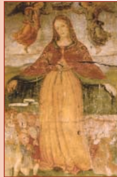
Mercatello, santuario della Madonna delle Grazie, Michelangelo di Maestro Matteo (?), "Madonna della Misericordia", affresco.

time from the last years of the XV century until the first half of Renaissance, after the dangerous Black Death of 1475.