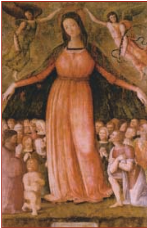
Olmeto, chiesa della Madonna delle Grazie. Ignoto, "Madonna della Misericordia" tempera su tavola, 1525.

tri saggi vicino alla casa colonica del Berioli restituirono tracce di due tombe a fossa di forma irregolare, completamente esplorate, presso cui rimanevano piccoli frammenti di bronzo e di bucchero.