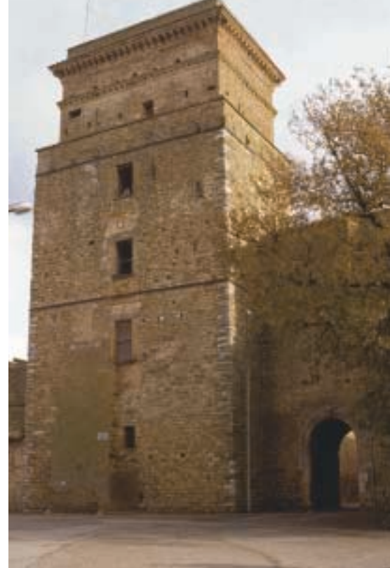
Borgo di Sant’Elena, torre e porta d’ingresso