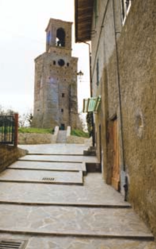
Borgo Medievale di Papiano, torre campanaria con orologio fine XIII sec.

ca tra le chiese confermate al monastero di San Pietro "sub castro Papiniano ecclesia di santi Silvestri cum sua pertinentia", che purtroppo oggi non esiste più. Del 1163 è il diploma di Federico Barbarossa che attribuisce la chiesa di Sant'Angelo ai benedettini di San Pietro, a conferma del fatto che, già a partire dal Mille, questo è uno dei luoghi da cui si diparte e dove si concentra l'opera di colonizzazione dei benedettini dell'abbazia perugina.