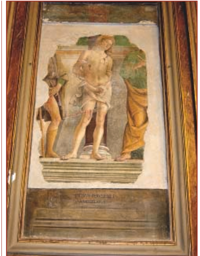
Cerqueto, Chiesa Parrocchiale di Santa Maria Assunta, Perugino, “San Sebastiano con San Rocco e San Pietro(?)”, affresco, 1478

sta al limitare del borgo antico in via Pietro Vannucci, raffigura Santa Lucia, San Rocco e la Madonna col Bambino; l'affresco, che fu erroneamente attribuito in passato a Tiberio d'Assisi, sembra ora essere stato compiuto da un allievo del Perugino .