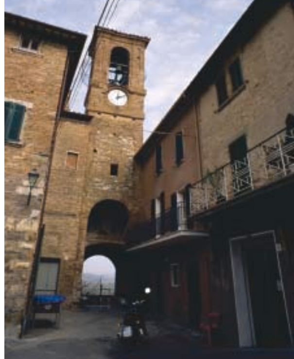
Castello delle Forme, torre campanaria con orologio XIII sec.